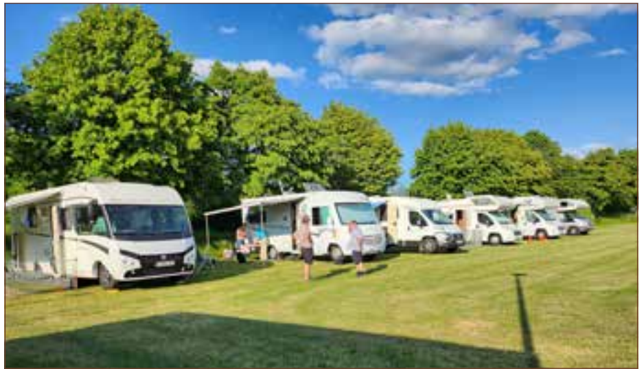
Die Camper erfreuen sich an der tollen Lage direkt am See