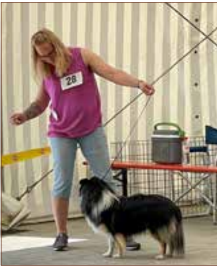
Bei der Bewertung kommt es auf Details an