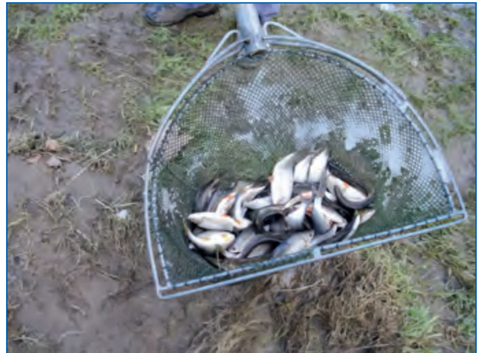
Rotaugenbesatz in der Mittelsauer Winter 2023

Vom Besatzplan 2021/2022 fehlen noch 3000 Rotfedern für den Hauptstau Esch/Sauer.