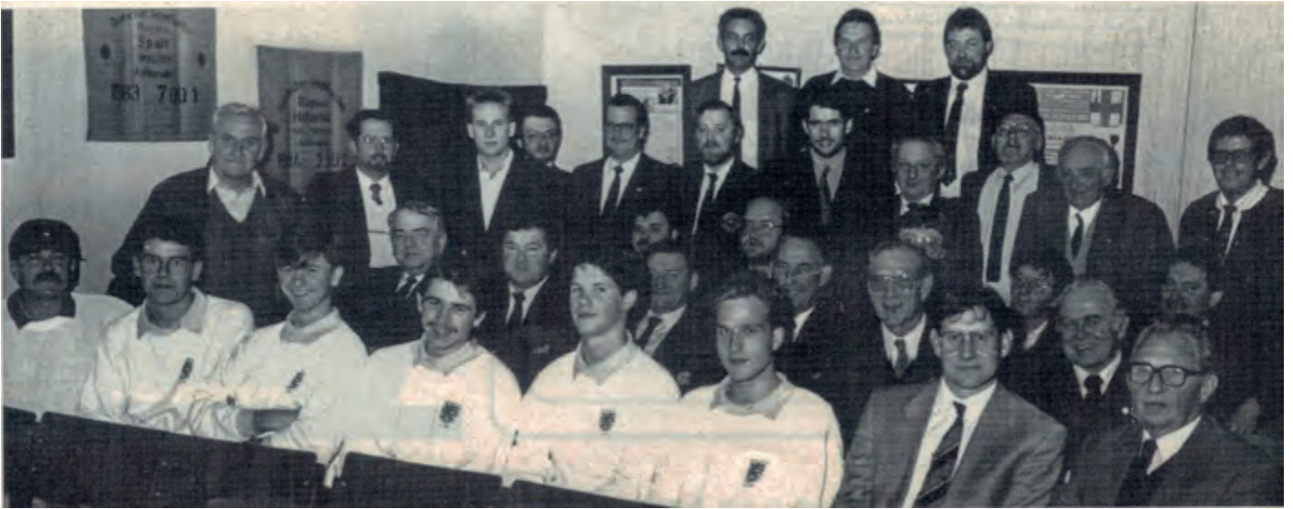
Traditionell gi jo all Joer verdéngschtvoll Sportfëschcher ausgezeechent. 1990 war dat an der Brauerei Bofferding.

Wann ech ee Réckbléck iwwer 1990er Jore maachen, da gëtt et natierlech een Thema deen d’Fëschcher permanent beschäftegt hat: den Dossier „Haff Réimech“. Ech sinn op dëser Plaz schonn drop agaangen a wäert nach e puermol iwwer déi Episod, déi eis vill Zäit a Nerve kascht hat, hei schreiwen. Mir waren eis als Zentralvirstand bewosst, datt et an dësem Dossier ëm eng prinzipiell Fro géing goen: Ass et berechtigt an enger Naturschutzzon d’Fëscherei ze verbidden? An dat och nach a Privatgewässer! Fir de Verband war dat onvirstellbar an dofir hu mir eis mat alle Mëttele géint déi absurd Virstellungen vum Ëmweltministère gewiert.